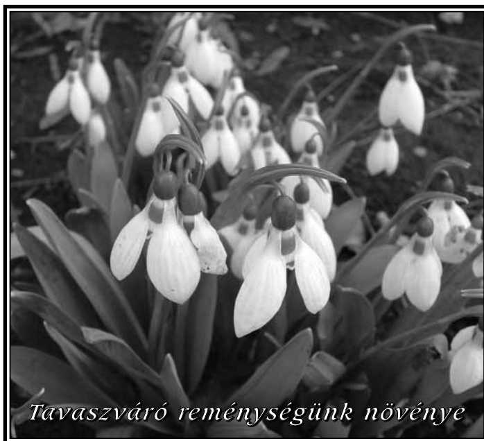
Tavaszcseresznye reménységünk növénye