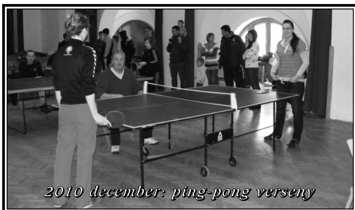
2010 december: ping-pong verseny