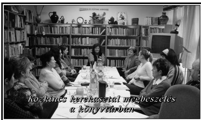
Közkincs kerekasztal megbeszélés a könyvtárban