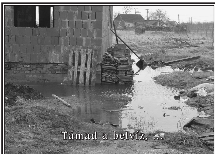
Támad a belvíz, ...

"Az alföldi emberben az is különleges, hogy esetében egy kívülálló nem tudja elválasztani a bölcsességét, a butaságától."