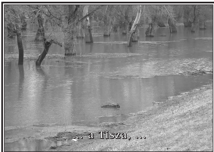
... a Tisza, ...