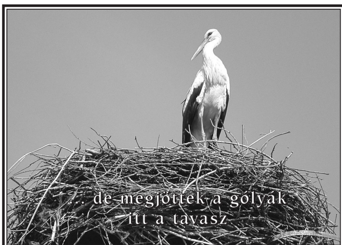
de megjöttek a golyak itt a tavasz