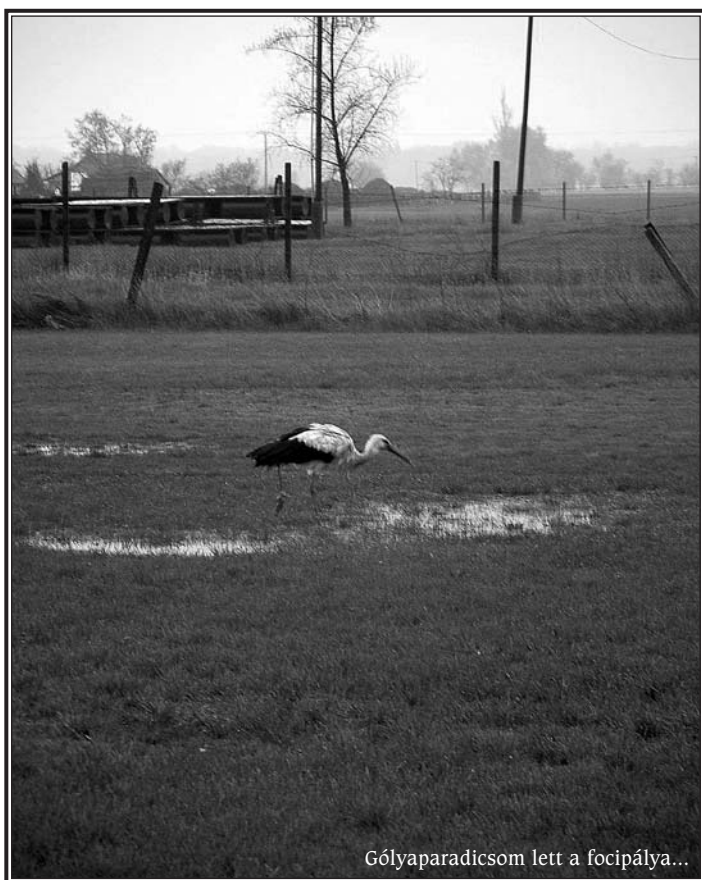
Gólyaparadicsom lett a foci pályája...