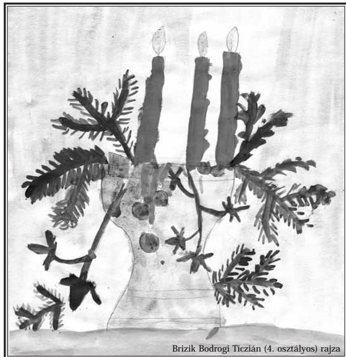
Brizik Bodrogi Ticsián (4. osztályos) rajza