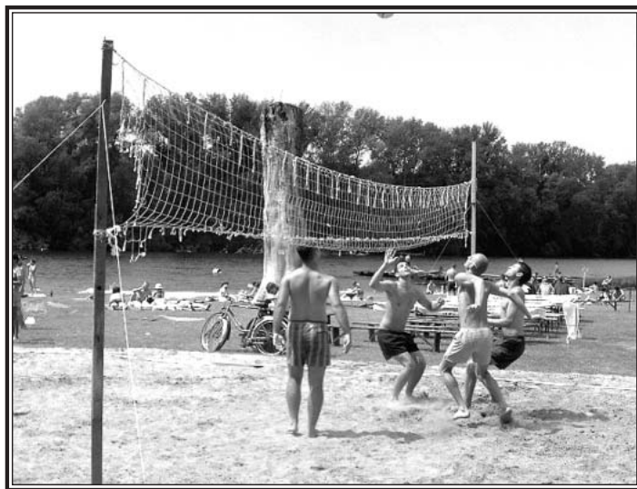
Szakadt a háló, de nagy az igyekezet...