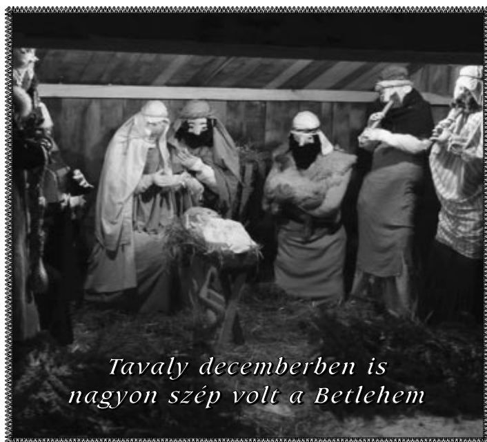
Tavaly decemberben is nagyon szép volt a Betlehem

És itt vetődik fel a leglényegesebb kérdés, a képviseleti demokrácia és annak valós működésének kérdése. Hogy hogyan szolgálja, segíti, könnyíti meg az itteniek életét, lehetőségeit, jövőjét. Például, hogy az iskola ügyében a fogadóóráján sorban álló faluvezetők órákon át történő várakoztatása, majd a titkárnővel küldött üzenet, hogy fontos ügyben el kellett távoznia, mennyire vall áldozatos, empatikus és segítőkész országgyűlési képviselői munkára? Na és az a tény, hogy az eltelt négy évben egyetlen egyszer sem tette tiszteletét egyetlen fórumon, közmeghallgatáson, képviselő testületi ülésen, s maga sem kezdeményezett országgyűlési képviselői minőségében egyetlen fogadóórát sem a falu bármelyik középületében, mit mutat? Nem azt mutatja, hogy szemtől szemben nem tartja érdekesnek a Mártélyiakat a képviseletükre, arra, hogy (folytatás a következő oldalon)